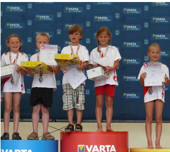
So klein und doch schon ganz groß: Die Sieger der Bambinis.

Nicht nur die sportlichen Ereignisse sorgten für gute Stimmung im Freizeitbad Roth, sondern auch das Rahmenprogramm: Neben einem Kletterturm der AOK konnten die rund 1.200 Besucher beim Team vom Erlebnistagemobil verschiedene Seil- und Balancespiele ausprobieren.